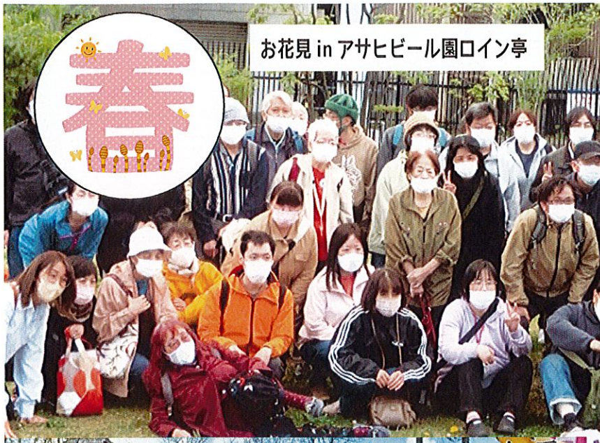
お花見 in アサヒビール園ロイン亭