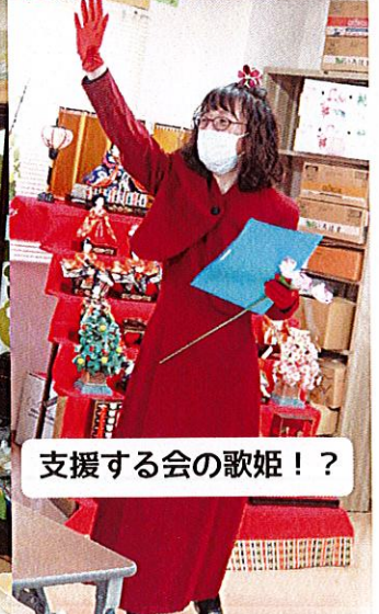
支援する会の歌姫!?