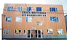
(このビル1階がHAPPYです)