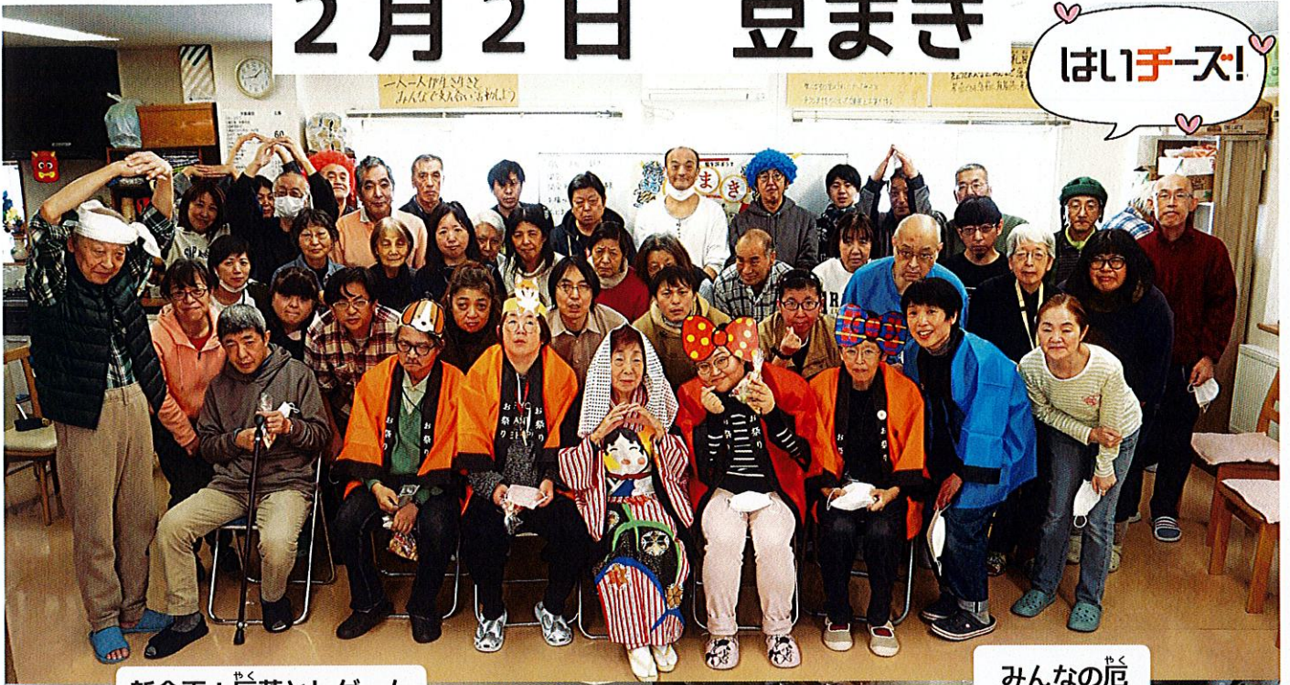
新企画! 危落としゲーム